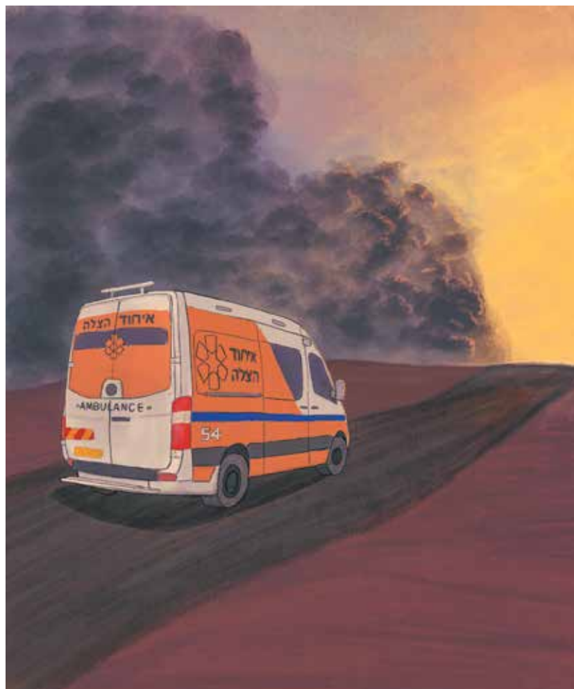
איור: שרון ארדיטי

ורק השנה, מתוך הבושה, והאהבה, והצער והתקווה, רק השנה אני מבין את השיר הזה. אנחנו נמצאים בתקופה קשה ומרה, בימים שהם לא יום ולא לילה. יש לנו מדינה, ואין לנו מדינה. יש לנו תקווה, ואין לנו תקווה. יש לנו מלחמה, ואין לנו מלחמה. היום הנורא והאכזרי שעברנו, התגלה כיום של אומץ, חמלה ואהבת אדם. והכול מאיתו יתברך. ואם אתם כמוני לא מאמינים. אז ככה עובדים החיים. יום ולילה. אור וחושך. בבת אחת. הכול מעורבב. וצריך שומרים על העיר. שיגנו עלינו. צריך שומרים שיהפכו את הסיפור היהודי לסיפור ישראלי. שיהפכו את התבוסה לניצחון, את החרדה לביטחון. לפני חצי שנה ושבעים, בשעת בוקר מוקדמת, בשעה שהיא לא יום ולא לילה, נכשלנו, הובסנו, נרדמנו בשמירה. ולכן חשוב שיהיו שומרים, שיגנו על העיר. ביום ובלילה. כל הזמן. ורק ככה, לאט לאט, מתוך הישראליות הבוטחת הזו. לילה כיום יאיר. אני מאמין. חג חירות שמח, אהובים.